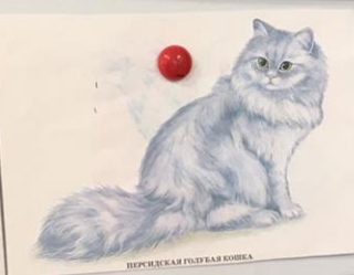
ПЕРСИЙСКАЯ ГОЛУБАЯ КОШКА