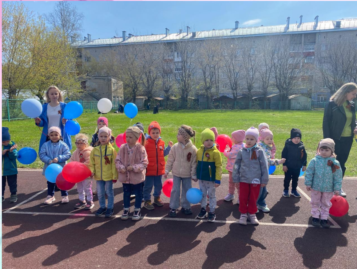
Шествие «Бессмертный полк»

Цель: рассказать детям о значимости этого праздника, воспитывать уважение к защитникам Отечества.