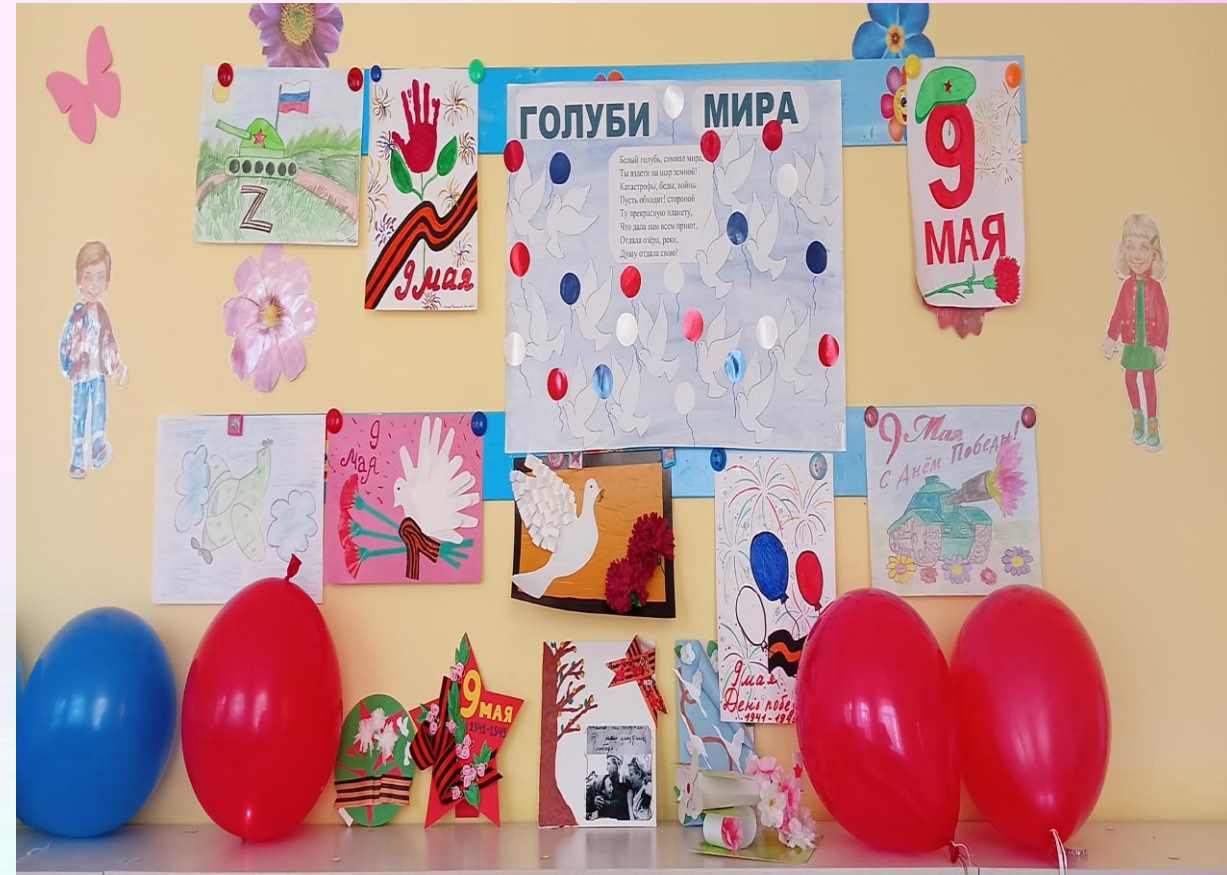
Выставка детских работ